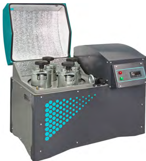
Мельница планетарная МПП 1-4