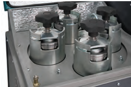
Платформа МПП 1-4 с чашами

Измельчение на МПП 1-4 Материал: Электрокорунд Производительность: 24 пробы/час