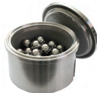
Чаша МПП 1-4