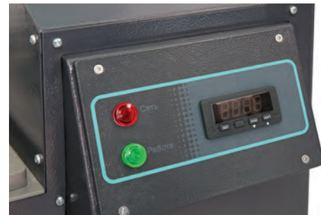
Панель управления с таймером